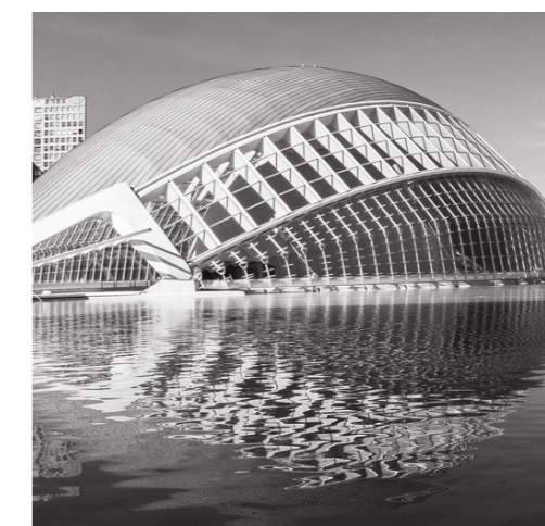
L' Hemisfèric Valencia Sanitago Calatrava