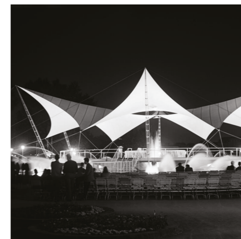
Tanzbrunnen der Bundesgartenschau 1957 in Köln Frei Otto